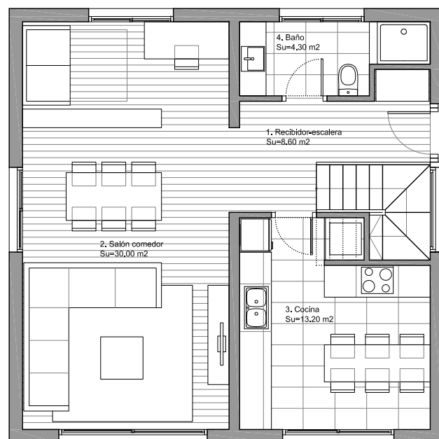
PLANTA BAJA ESC. 1/100